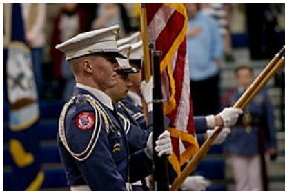
Un guardia de color de la Academia Militar de Oak Ridge (2015)

La declaración de la misión de la academia es: